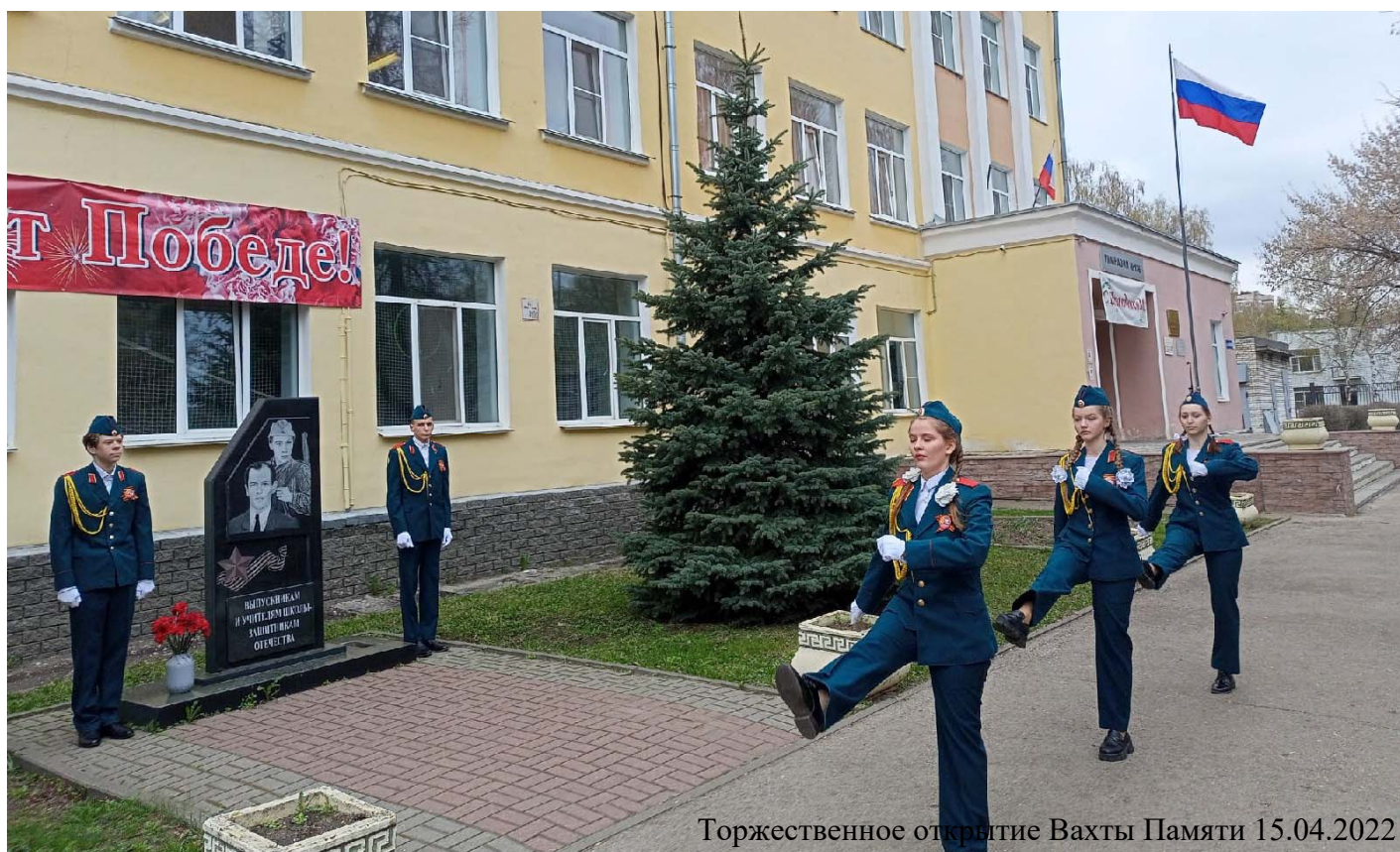
Торжественное открытие Вахты Памяти 15.04.2022

15 апреля 2022 года в МБОУ «Гимназия №136» состоялось торжественное открытие «Вахты Памяти». Это мероприятие традиционно проводится в нашей школе с 2015 года. Ежегодно в рамках месячника Памяти проводятся различные мероприятия: проходят часы мужества, на которых обучающиеся встречаются с ветеранами и представителями общественности, линейки Памяти, митинги и, безусловно, мы принимаем участие в шествии Бессмертного полка 9 мая.