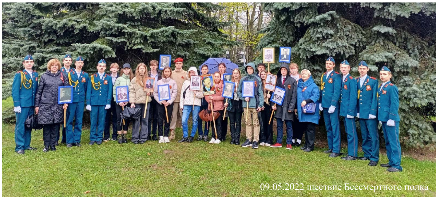
09.05.2022 шествие Бессмертного полка