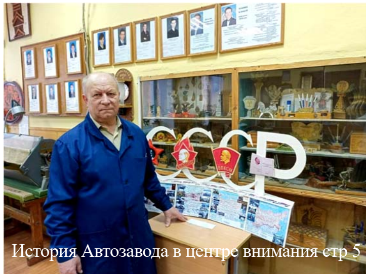
История Автозавода в центре внимания-стр 5