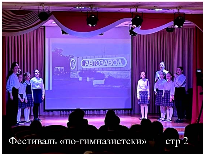
Фестиваль «по-гимназистски» стр 2